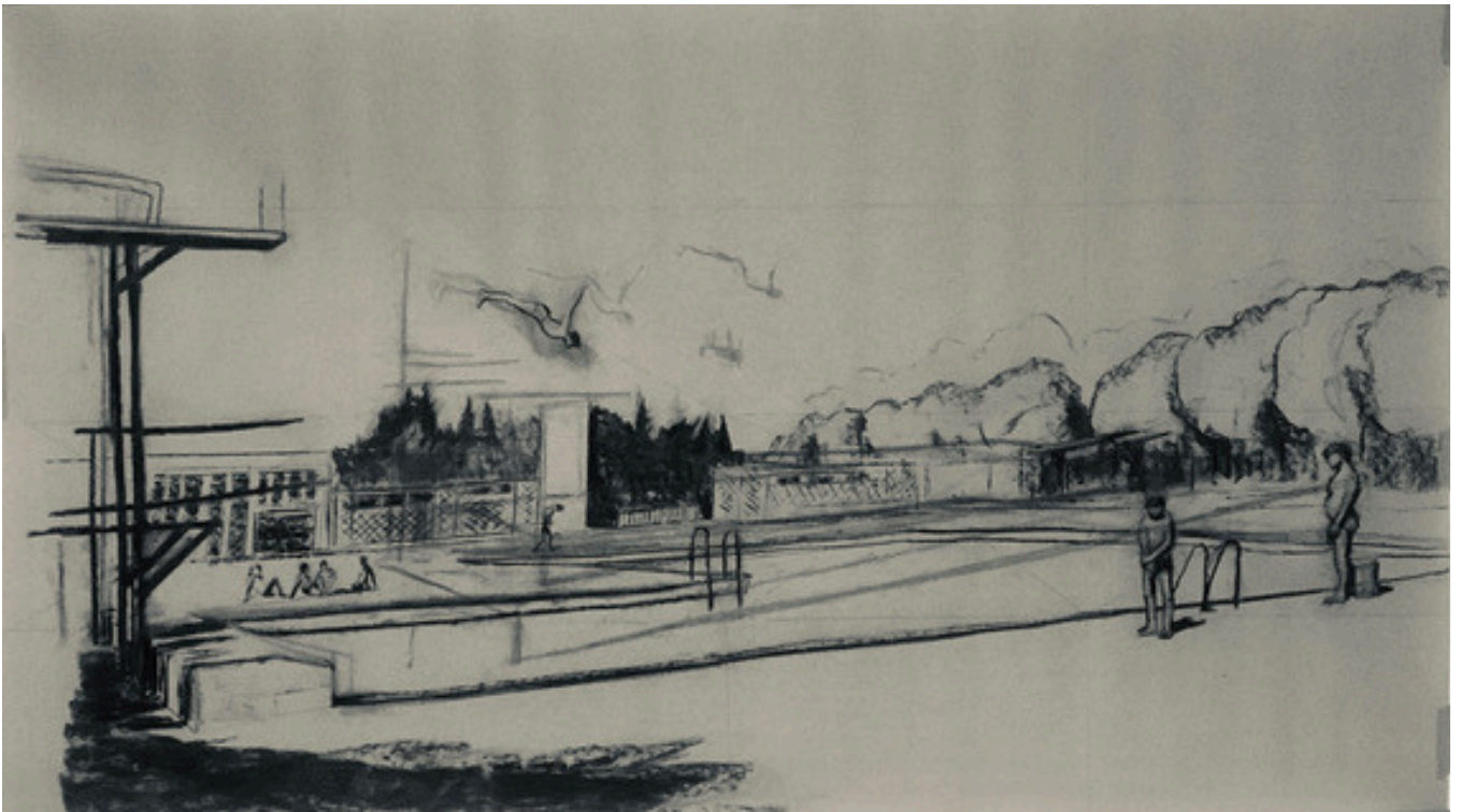
A la piscine municipale

Fusain sur papier craft, 97 x 150 cm, 2024