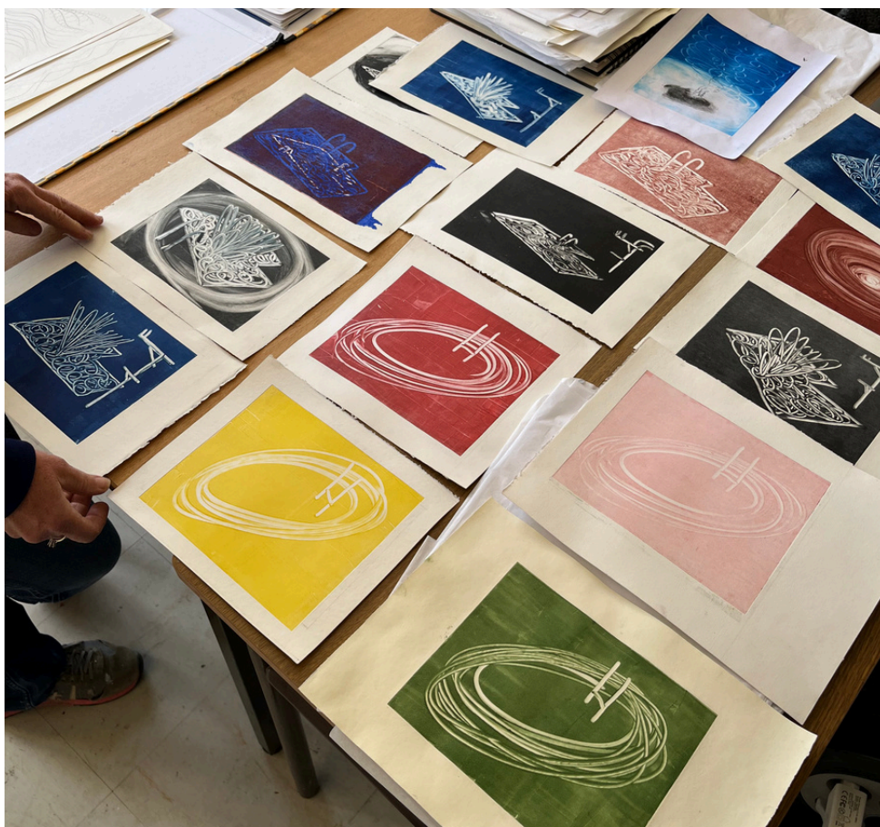
Sans titre Série de monotypes 17 x 20 cm